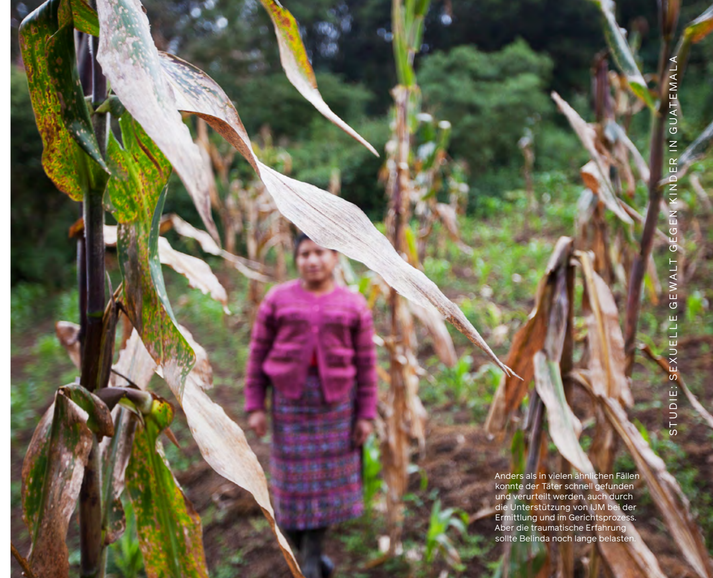
STUDIE: SEXUELLE GEWALT GEGEN KINDER IN GUATEMALA

Während der Grundlagenstudie arbeitete IJM mit der Generalstaatsanwaltschaft zusammen, um Verwaltungsdaten zu Fällen von sexueller Gewalt gegen Kinder zu erhalten, die zwischen 2008 und 2012 eingereicht wurden. IJM sammelte ebenfalls Informationen aus Dokumenten von