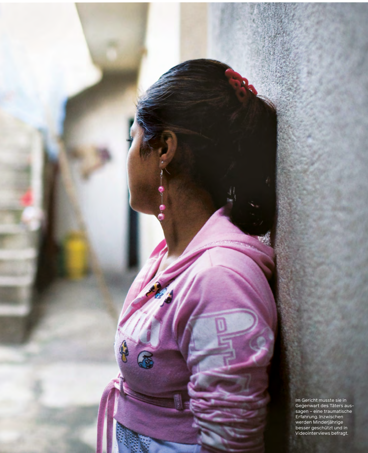
Im Gericht musste sie in Gegenwart des Täters aussagen – eine traumatische Erfahrung. Inzwischen werden Minderjährige besser geschützt und in Videointerviews befragt.

fünf Jahren verändert hat und zu bestimmen, in welchen Bereichen bereits Verbesserungen erzielt wurden und die Bestrebungen zu unterstützen, die innerhalb des Rechtssystems vorgenommen wurden, um die Reaktion auf Fälle von sexueller Gewalt gegen Kinder zu verbessern.