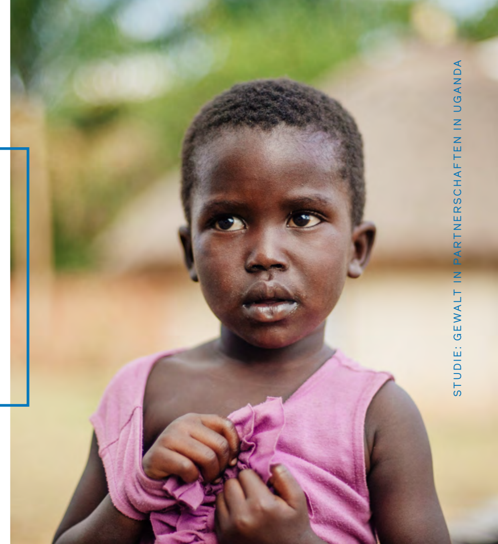
STUDIE: GEWALT IN PARTNERSCHAFTEN IN UGANDA

Deutliche Mängel in den Ermittlungskapazitäten beeinträchtigen die Wahrscheinlichkeit einer erfolgreichen Strafverfolgung. Erhebliche Mängel wurden vor allem bei der Aufnahme der Zeugenaussagen, bei der Beweissammlung am Tatort und der gerichtsmedizinischen Untersuchung festgestellt.