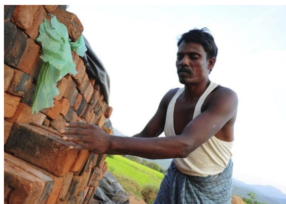
Dieser Mann muss in einer Ziegelfabrik in Südasien arbeiten

Das Gegenteil ist der Fall – obwohl Sklaverei und Menschenhandel in jedem Land der Welt eigentlich verboten sind! Nach Schätzungen leben heute etwa 50 Millionen Menschen in Sklaverei. Das sind mehr als zu irgendeinem anderen Zeitpunkt in der Geschichte. In Sklaverei zu leben bedeutet, dass man zur Arbeit gezwungen und festgehalten wird – durch Täuschung, durch Androhung einer Strafe oder durch Gewalt. Viele der Menschen in Sklaverei sind Kinder. Sie können oft nicht zur Schule gehen und gefährden durch die harte Arbeit ihre Gesundheit.