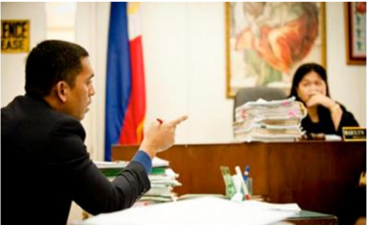
Dieser Anwalt unterstützt einen ehemaligen Betroffenen von Sklaverei dabei, vor Gericht eine Aussage zu machen.

Deswegen ist es wichtig, dass es Menschen gibt, die dafür sorgen, dass Gesetze – die beispielsweise verbieten, Menschen in Sklaverei zu halten – durchgesetzt werden. Das heißt, dass Sklavenhalter/-innen gesucht, vor Gericht gebracht und bestraft werden. Dafür müssen Polizei und Richter/-innen gut geschult werden und Anwälte/-innen gefunden werden, die sich für diese Menschen einsetzen. Denn nur wenn die Täter/-innen merken, dass ihre Taten bestraft werden, werden sie davon abgehalten, weitere Verbrechen zu begehen.