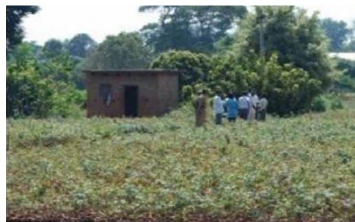
Rosenpflanzen und eine Hütte, in der die Arbeiter leben müssen.