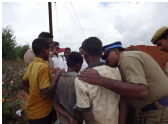
Die Jungen werden von einem Team aus Polizisten und Ermittlern aus Sklaverei befreit.

Durch die Aussagen der vier Jungen ist es möglich, dass der Besitzer der Rosenfarm angezeigt wird und sich vor Gericht verantworten muss.